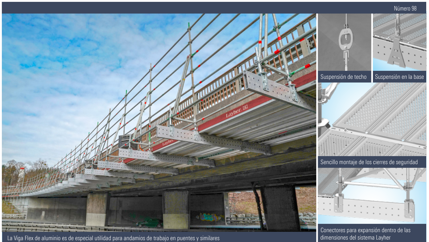
La Viga Flex de aluminio es de especial utilidad para andamios de trabajo en puentes y similares