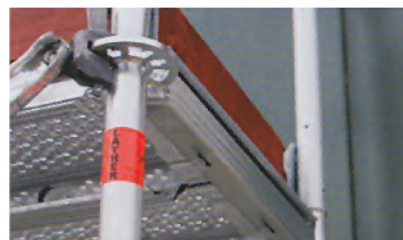
Montaje lateral usando la roseta Allround