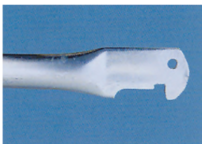
Las barandillas ligeras son montadas sin usar herramientas

La seguridad durante el transporte es una cuestión muy importante también para Layher. El pallet de tubo 125 admite 14 marcos STAR, manteniendo un orden correcto en el área de almacenamiento. Los marcos STAR son apilados con el extremo abierto colocado alternativamente hacia la derecha y hacia la izquierda.