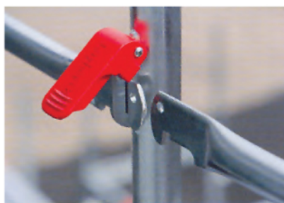
Los soportes de barandillas indican cuando las barandillas no están aseguradas