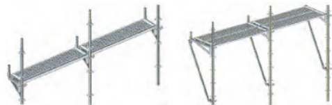
Usando ménsula Allround 0,36 m.